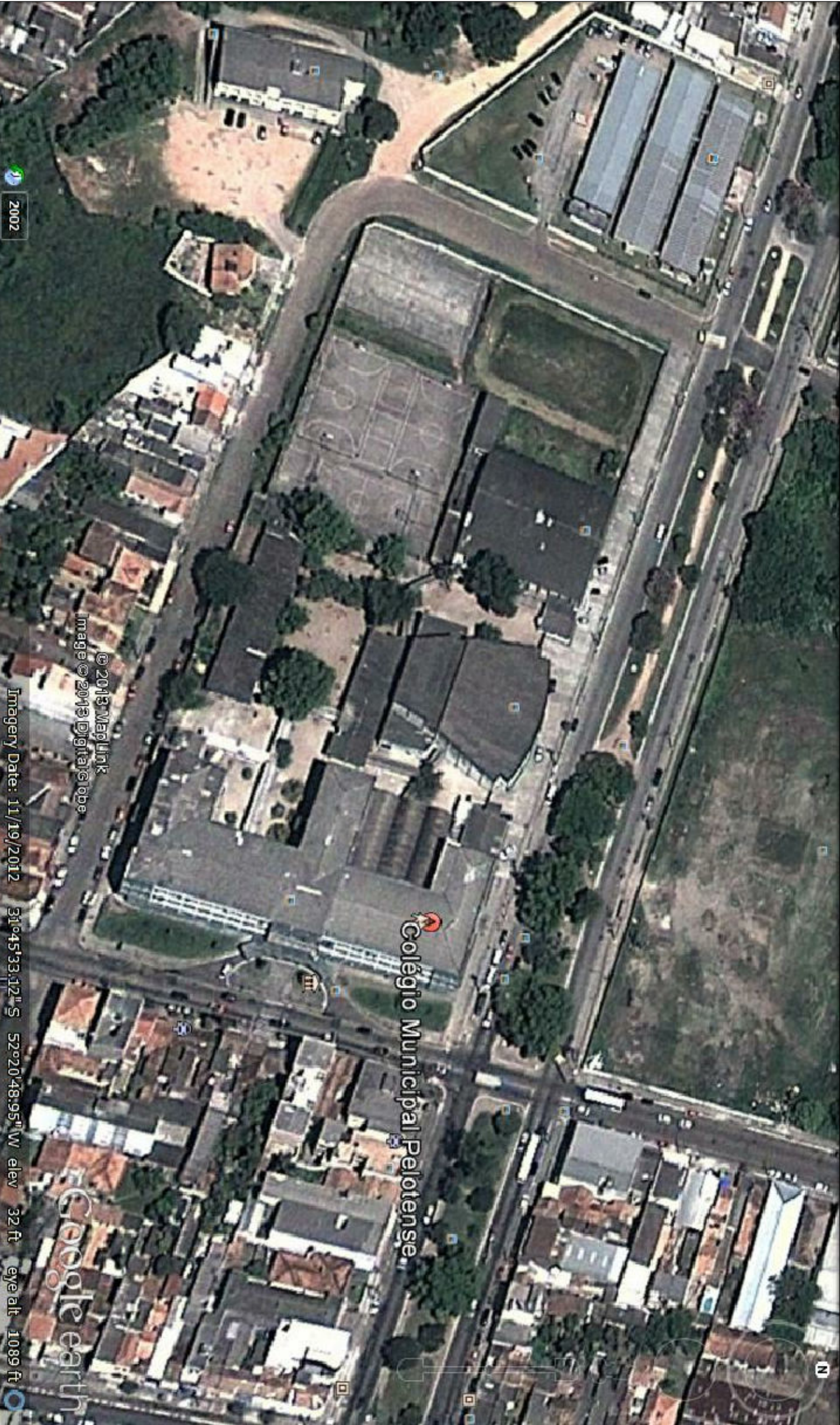
IMAGEM DO GOOGLE EARTH